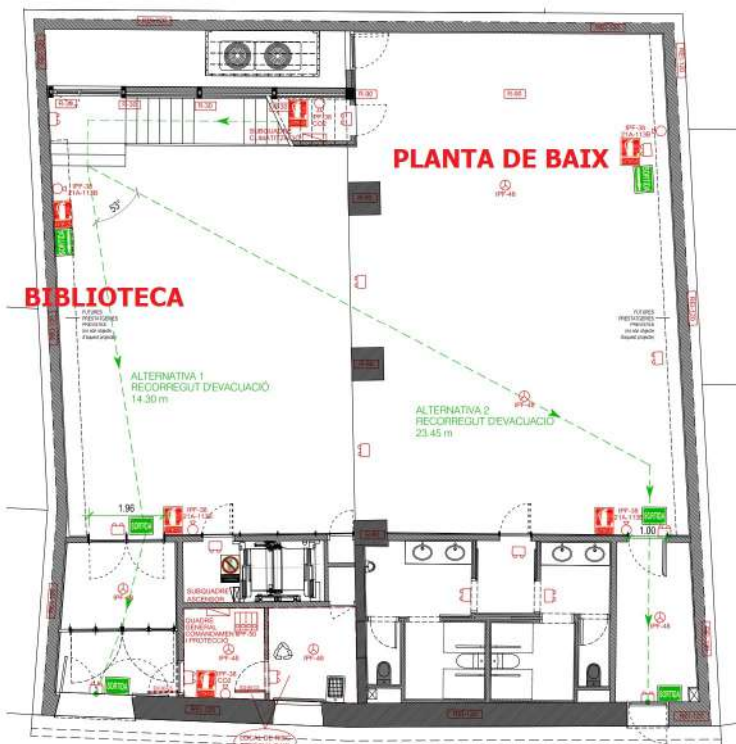
PLANTA BAIX E 1:50 (A1) - 1:100 (A3)