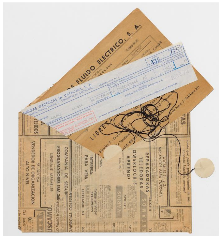
Joan Brossa, Poema , Extret de Poemes habitables 8 , 1970