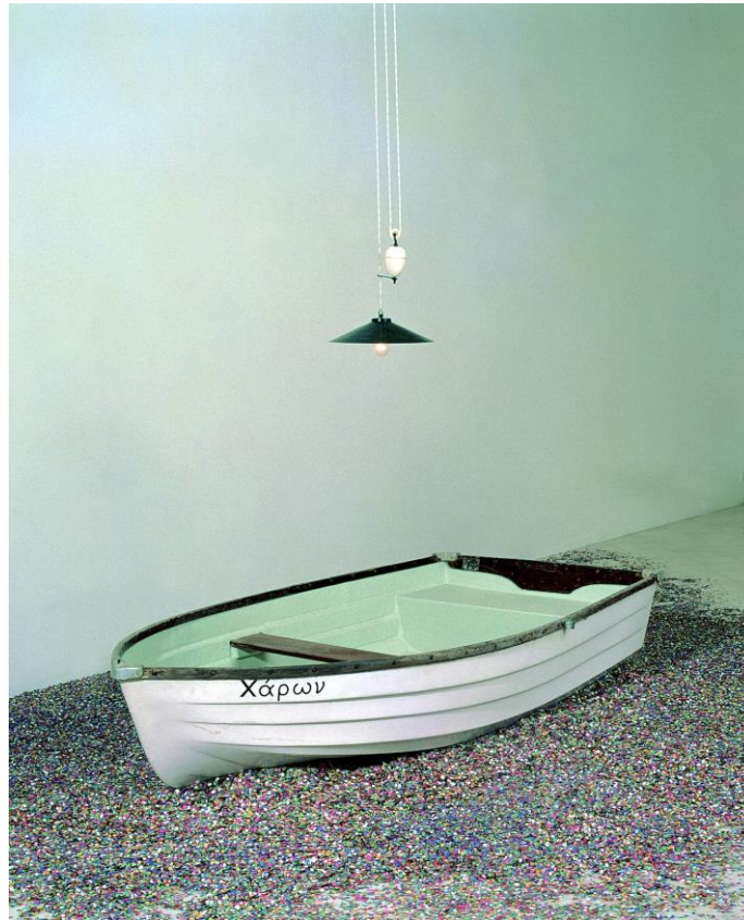
Joan Brossa, Caront , 1998 © Fundació Joan Brossa